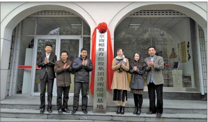
北京商鲲教育落户章丘电大

学优势，有一流的师资队伍，取得了一流的教育成绩。建校30多年来，学校先后获得国家开放大学“全国广播电视大学系统信得过考点”、山东省电大“首批示范县级电大”、“开放教育先进教学点”和“章丘市教书育人先进单位”等荣誉称号，在校生达3600余人。 目前学校正在招生中，今后学校将继续积极贯彻上级文件精神，结合当地实际，充分利用各方资源和力量，以就业为导向，着力培养“留得住、用得上、下得去”的应用型人才，为地方经济社会发展提供强有力的人才和智力支撑。 详情可拨打电话： 北京商鲲教育0531—83322789 QQ:3528358758 电大学历教育0531—83312041 报名地址：章丘市山泉路1359号社区教育学院一楼服务大厅(原教师进修学校西邻) 学校网址：http://www.skjyjt.com/(北京商鲲)；http://www.zqtvu.com/(章丘电大)