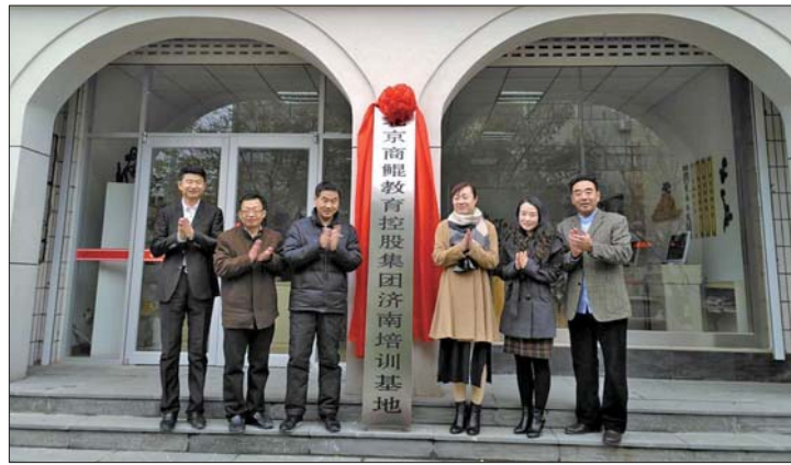
北京商鲲教育落户章丘电大。

学校网址: http://www.skjyjt.com/ (北京商鲲); http://www.zqtvu.com/ (章丘电大)