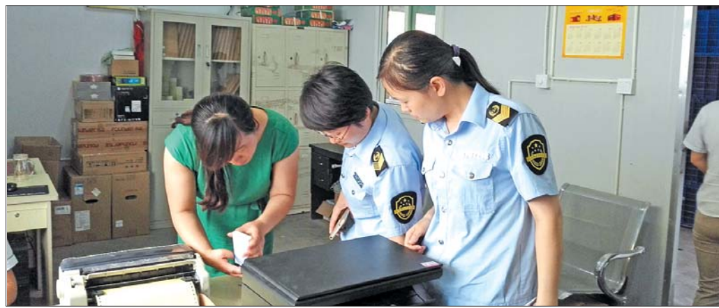
区食药局工作人员对辖区企业进行例行检查。(资料片)

加强职工教育培训,提高职工综合素质,把优质高效的服务放在名牌服务的核心。以核心价值观为指导,加强职工服务教育,增强名牌服务意识;全员参与和建设“涌泉”服务名牌,以客户满意为目标,从供水生产、输配到销售服务,形成名牌服务链条;明确名牌服务项目和标准,确立“涌泉”服务名牌的差异优势和个性特色;从解决客户的难点、热点问题出发,按照标准化原则,规范每一项细节,做到快速高效,不断增强“涌泉”服务名牌的活力和张力。