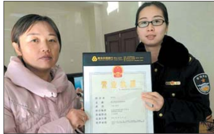
“两证整合” 执照开始颁发