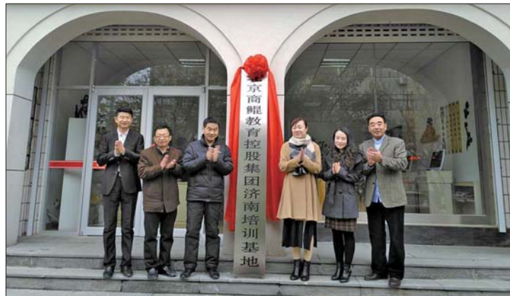
北京商鲲教育落户章丘电大

学校网址: http://www.skijyt.com/ (北京商鲲); http://www.zqtvu.com/ (章丘电大)