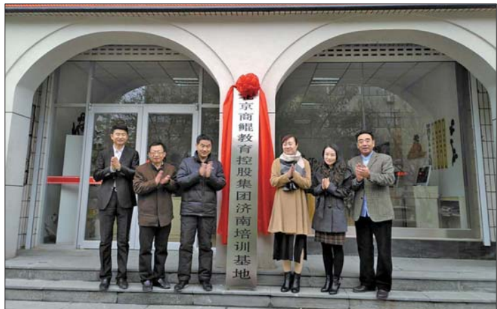
北京商鲲教育落户章丘电大

详情可拨打电话: 北京商鲲教育0531—83322789 QQ:3528358758 电大学历教育0531—83312041 报名地址:章丘市山泉路1359号社区教育学院一楼服务大厅(原教师进修学校西邻) 学校网址:http://www.skjyt.com/(北京商鲲);http://www.zqtvu.com/(章丘电大)