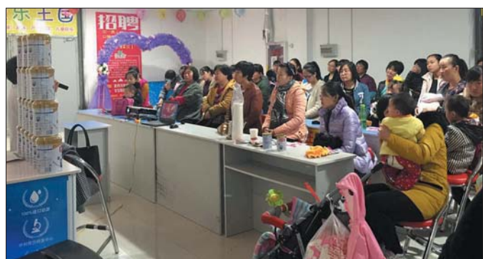
“妈妈课堂”现场气氛热烈。

本报12月1日讯(记者 梁越) 近日,爱亲童乐王国举办了“妈妈课堂”,并邀请了相关专家,为现场60余名孕妈妈讲解孕前准备、孕中检查以及孕后护理相关知识,不少女性直呼受益匪浅,希望多参加这样的讲座。