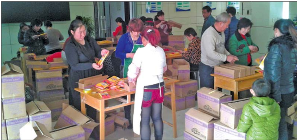
村民利用闲散时间封包铅笔。

另外还设立了村级集体经济发展贡献奖,对新增加的有集体经营性收入的村(居)给予绩效工资奖励,当年新增村级