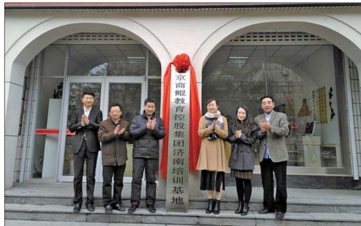
北京商鲲教育落户章丘电大

详情可拨打电话: 北京商鲲教育 0531-83322789 QQ: 3528358758 电大学历教育 0531-83312041 报名地址:章丘市山泉路1359号社区教育学院一楼服务大厅(原教师进修学校西邻) 学校网址: http://www.skijyt.com/(北京商鲲); http://www.zqtvu.com/(章丘电大)