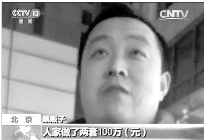
票贩子介绍,有人办了100万的假材料。

随后,记者和该男子商定,以700元的价格交易。在约定好的交易地点,记者见到了负责收集信息的票贩子同伙。