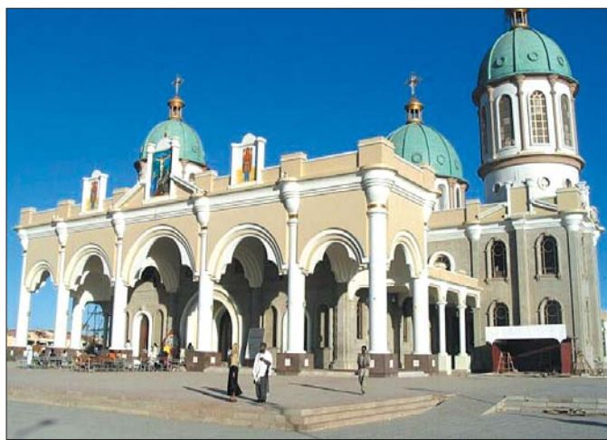
埃塞俄比亚的斯亚贝巴—夏夏木尼

大金庙又名阿姆利则金庙,是锡克教的圣地,位于印度边境城市阿姆利则市中心,整座金庙的建造共耗费750公斤黄金。这座被誉为“锡克教圣冠上的宝石”的建筑,风格典雅,造型优美,既有伊斯兰教建筑的肃穆庄重,又有印度教建筑的绚丽璀璨。大金庙完全由白色玉石和金色金属构成,从正门进来的人一般都会顺时针地从左边走,绕池子一周后,才从池子右边的入口进入金庙。大金庙是免费开放的,无论是游客还是朝圣者在那里都可以得到免费的食物。