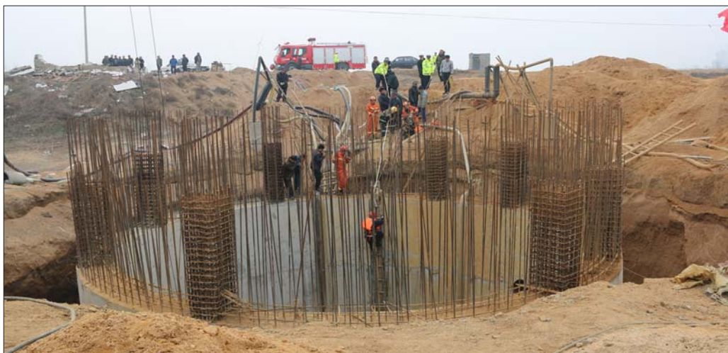
上图:消防官兵沿着拉梯深入井下将安全绳、板带双绳绑在被困人员身上,将2名被困人员安全救出。