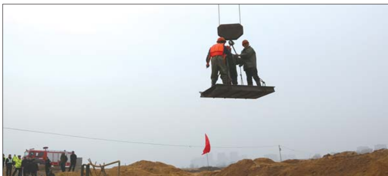
左图:恢复供电后,消防官兵采用塔吊营救其他被困人员。