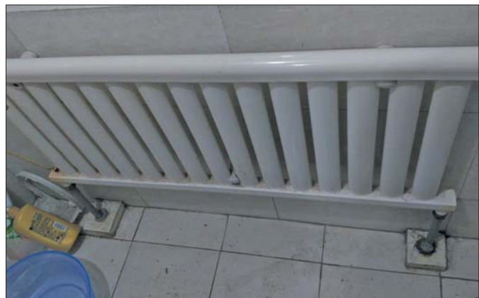
李女士家中暖气片凌晨时间经常变凉。

此外,业内人士表示市民也可以拿起法律武器进行维权,搜集相关证据并找到当初与物业签订的协议或合同到相关司法部门进行投诉。