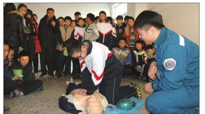
12月6日下午,济医附院兖州院区急救培训团队来到兖州区第八中学开展校园急救知识培训。结合学生的日常生活实际,讲解了骨折、烧伤、烫伤、鼻出血等常见意外情况的急救处理。

心)领办,并实行一体化管理。通过一体化管理的模式,有效促进了农村卫生资源的合理配置和充分利用,巩固了农村三级医疗卫生服务网络,为提高乡村卫生技术人员业务素质、规范医药市场和服务行为、保障新型农村合作医疗制度的实施以及满足广大农村居民医疗卫生需求方面发挥了重要作用。截止目前,累计建立个人健康档案61.24万人,儿童健康管理5.07万人,高血压健康管理5.32万人,糖尿病健康管理2.29万人,65岁老年人健康管理5.07万人,登记并规范管理重性精神病人2160人,为全县人民提供了公平可及的公共卫生服务。