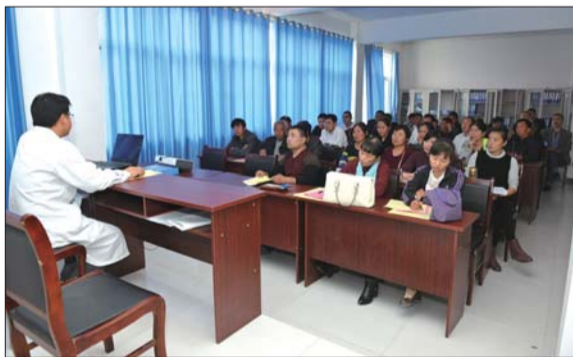
提升服务水平,村医进行集中学习。

这种情况不是特例,在南楼村,这里曾经的医疗环境十分落后,连固定的办公场所都没有,如今有了标准化的村卫生室,更加方便村医生的工作以及群众就医。村级卫生室条件的不断改善,村医生的业务