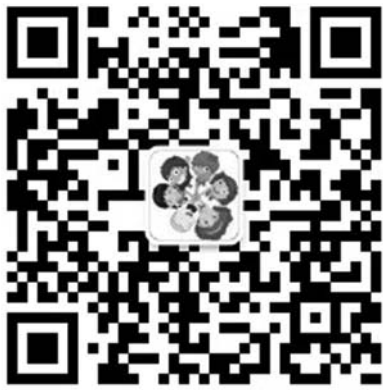
小记者扫码,写留言赢魔方或绿茶。

拥抱2017,回味2016年,在这过去的一年里,你最想对谁说点什么呢?详情请关注“今日泰山小记者团”,把你的心里话留言到平台,前一百名可免费领取价值38元比赛专用彩虹魔方或日照绿茶一袋。