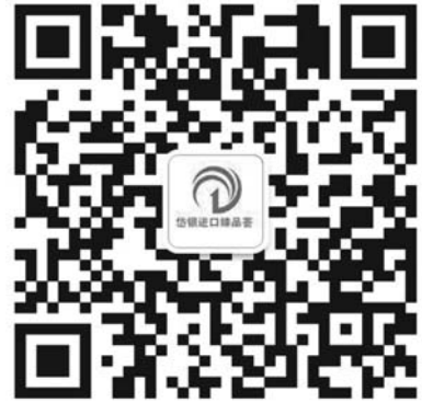
扫二维码关注,尝更多国外美食。

随着双十二网购节的到来,“岱银进出口臻品荟”也推出一系列优惠,西班牙进口果汁礼盒、满额返现等活动也将在12月12日启动,更多优惠信息请扫二维码关注“岱银进出口臻品荟”。