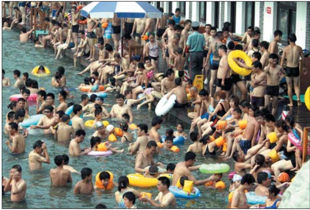
一到夏季,泉水浴场就像下饺子。市民盼望这种场所再多些。(资料片)

会上,对于泉水的保护和利用,济南市政协副主席张辉说出了自己的想法。“我觉得不让老百姓在护城河游泳的规定过于简单化。”张辉认为,老天赐给济南泉水,在世界上是独一无二的。“从我这一代算起,往上数,会游泳的,大部分是打小光着屁股在护城河里学会的……”张辉说:“现在不让游了,别说不让游了,趟个水都不行。去青岛,烟台,到海边趟水,人家那叫亲水。在济南脱了鞋一下