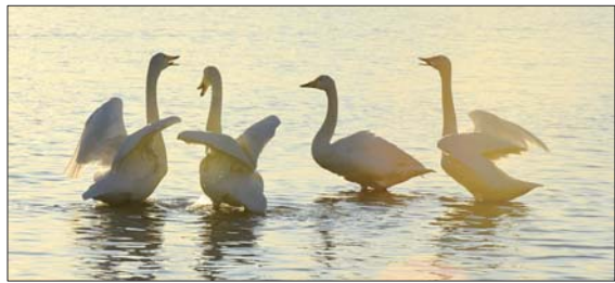
▲戴爱民 摄 ▼荣成天鹅 董鉴楷 摄