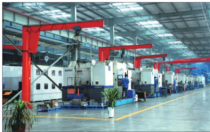
泰丰液压入围中国制造业单项冠军示范企业。

今年3月，国家工信部启动“制造业单项冠军企业培育提升专项行动”，旨在引导中国制造业企业专注创新和产品质量提升，推动产业迈向中高端，带动“中国制造”走向世界。