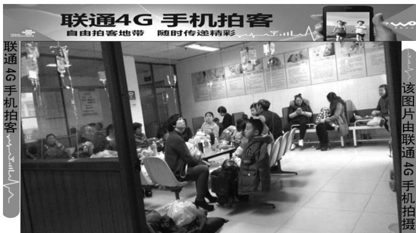
输液室里坐满了患儿和家长的。

记者调查发现,不止这所学校,泰安的多所学校都出现了学生感冒的情况。一位学生家长在朋友圈发了一张截图,全部都是向班主任请假的,她截屏