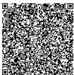
扫码查看更多中小学改扩建信息。

同时,学校西侧的科技中路、东侧的规划四路、北侧的规划一路也在建设中,为学校学生的上学提供便利的交通。