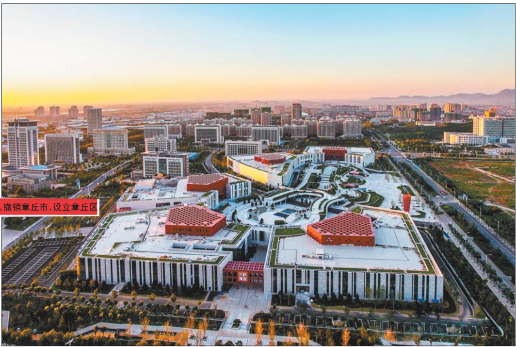
鸟瞰章丘市文博中心。