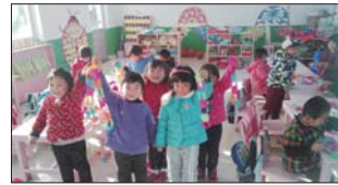
沂源县南鲁山镇中心园多种形式庆祝元旦。