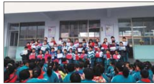
埠村希望小学在科学技能抽测中取得佳绩。(唐秀娟)