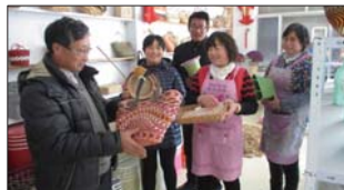
悦庄镇成教中心学校积极推广草编工艺。