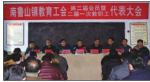
南鲁山镇二届一次教职工代表大会召开。