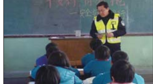
悦庄镇埠村希望小学认真开展交通安全课。(唐秀娟)