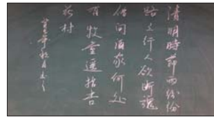
沂源县三岔中心学校教师注重基本功练习。(仝和田)