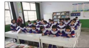
沂源县土门中学成立少年宫丰富学生的课余生活。