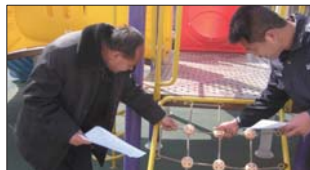
沂源县悦庄镇中心幼儿园开展安全隐患大排查。(马淑英)