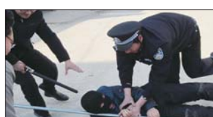
沂源县西里镇中心小学组织“校园防暴演练”。(张克强)