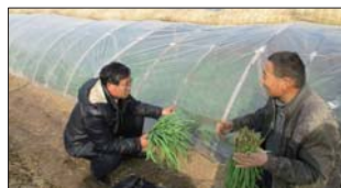
悦庄镇成教中心学校老师对菜农进行技术指导。