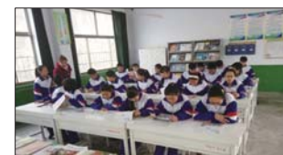
沂源县三岔中心学校开展兴趣小组活动。(仝和田 李静)