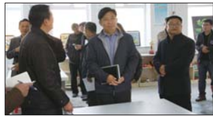
鲁山路小学通过县义务教育均衡创建验收。