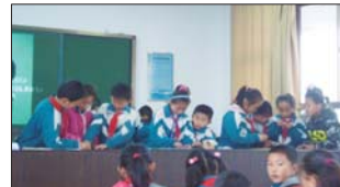
悦庄镇埠村希望小学积极上好实践活动课。(唐秀娟)