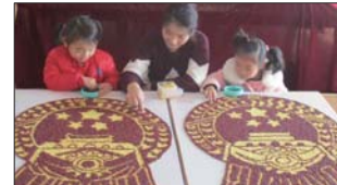
近日,悦庄镇中心幼儿园举行法制教育。(马淑英)