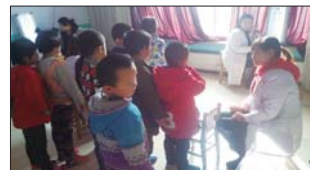
近日,悦庄镇中心幼儿园举行健康查体活动。(王明花)