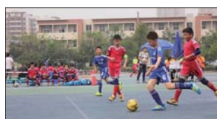
沂源县鲁村镇中心小学开展了班级足球比赛。(李传新)