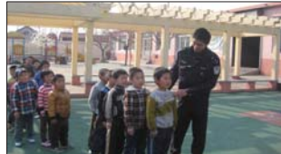
悦庄镇中心幼儿园邀请交警讲解交通安全。(马淑英)