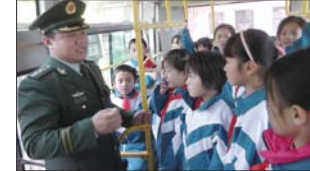
沂源县悦庄中心小学积极开展学生乘车安全教育活动。