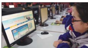
沂源县土门中学积极上好安全教育课程。