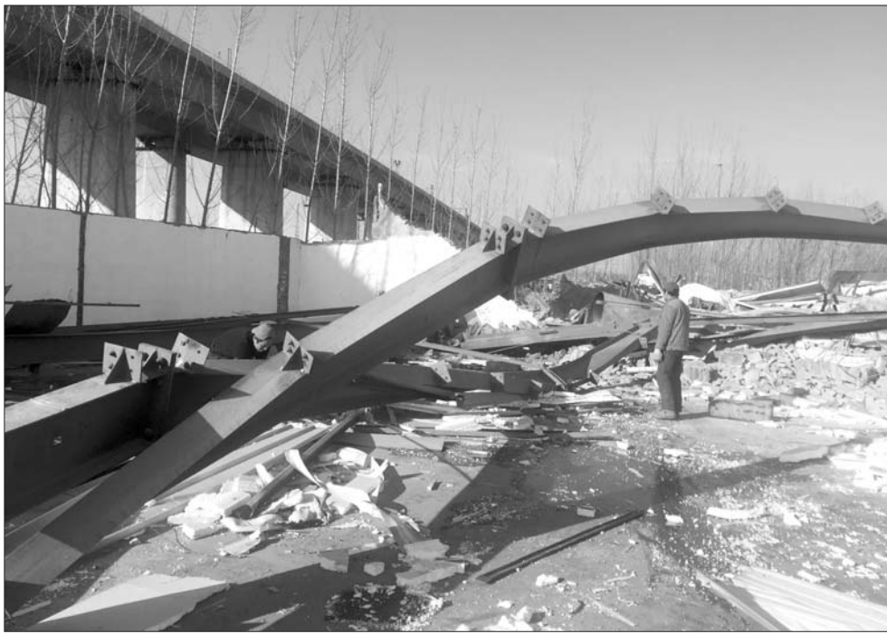
23日下午,几名工人正在厂区内清理废品。

在巡查中,要根据安全生产工作不同情况对地方政府、部门和企事业单位负责人进行约谈,提出明确整改意见并要求地方政府及时报告落实情况。同时,各巡查组对所有巡查工作过程都要做好记录,所有问题的处理都要实行闭环管理。