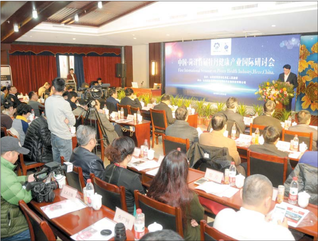
中国菏泽首届牡丹健康产业国际研讨会召开。

本报菏泽12月25日讯(记者 邓兴宇) 23日上午,中国菏泽首届牡丹健康产业国际研讨会在“中国牡丹之都”山东菏泽开幕。本活动由菏泽市牡丹区人民政府主办,山东尧舜集团菏泽尧舜牡丹生物科技有限公司承办,旨在围绕牡丹与大健康产业发展进行学术交流,助力牡丹产业持续快速发展。