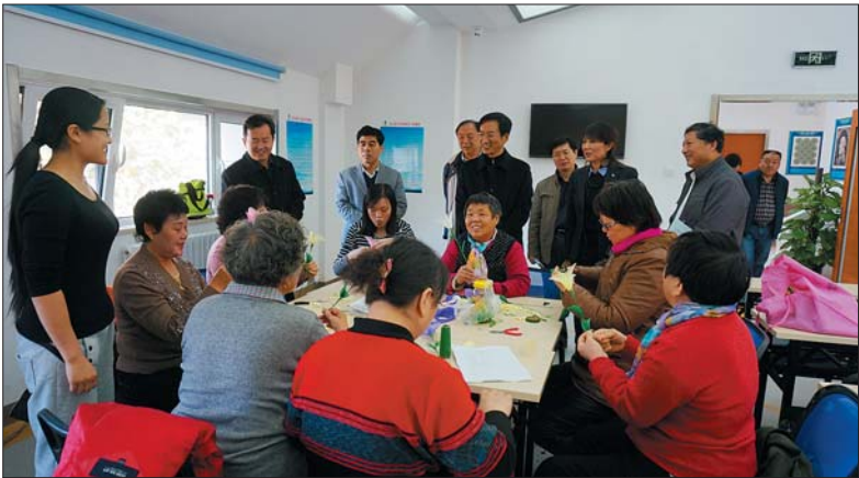
12 月 1 日上午,潍坊市老龄委到旬柳第三社区参观学习,参观组一行实地察看了社区服务大厅、老年活动中心、舞蹈室、图书馆、书法室、阴军工作室、老年大学等活动场所。参观组还与正在学习制作丝网花的老年朋友进行了交谈,并对老年朋友制作的丝网花赞不绝口。(林媛媛)