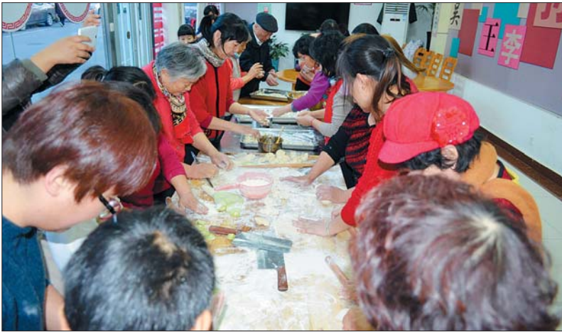
旬柳第一社区于 2016 年 12 月 23 日,在旬柳一居老年食堂举办“情暖冬至,爱在社区”主题活动,活动共有 20 户家庭前来参加。有的家庭准备了一个才艺展示节目,有的家庭也精心准备了一道美味的菜品,大家制作及品尝冬至水饺、欣赏精美的才艺表演,大家其乐融融,沉浸在幸福快乐的时光之中。(林媛媛)