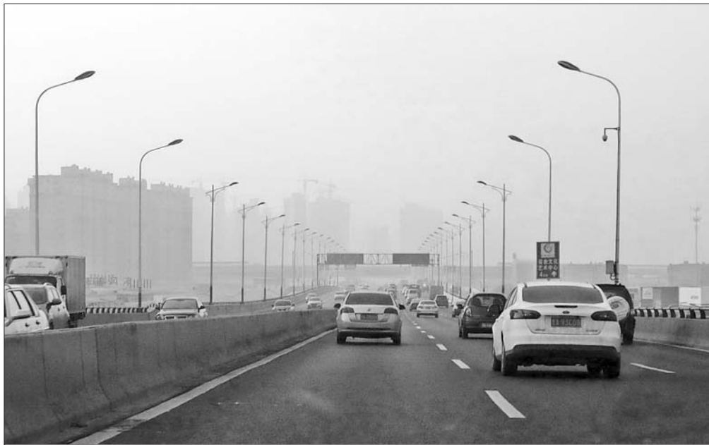
3日,济南虽是大晴天,却依然遭遇重度污染。

自2016年12月29日起,截至2017年1月3日17时,我省共有16市发布重污染天气预警,济南、德州、聊城3市按照省重污染天气应急工作小组要求,发布红色预警并启动I级应急响应;淄博、济宁、泰安、莱芜、临沂、滨州、菏泽7市发布橙色预警并启动II级应急响应;枣庄、东营、潍坊、日照4市发布黄色预警并启动III级应急响应;青岛、烟台2市发布蓝色预警并启动IV级应急响应。