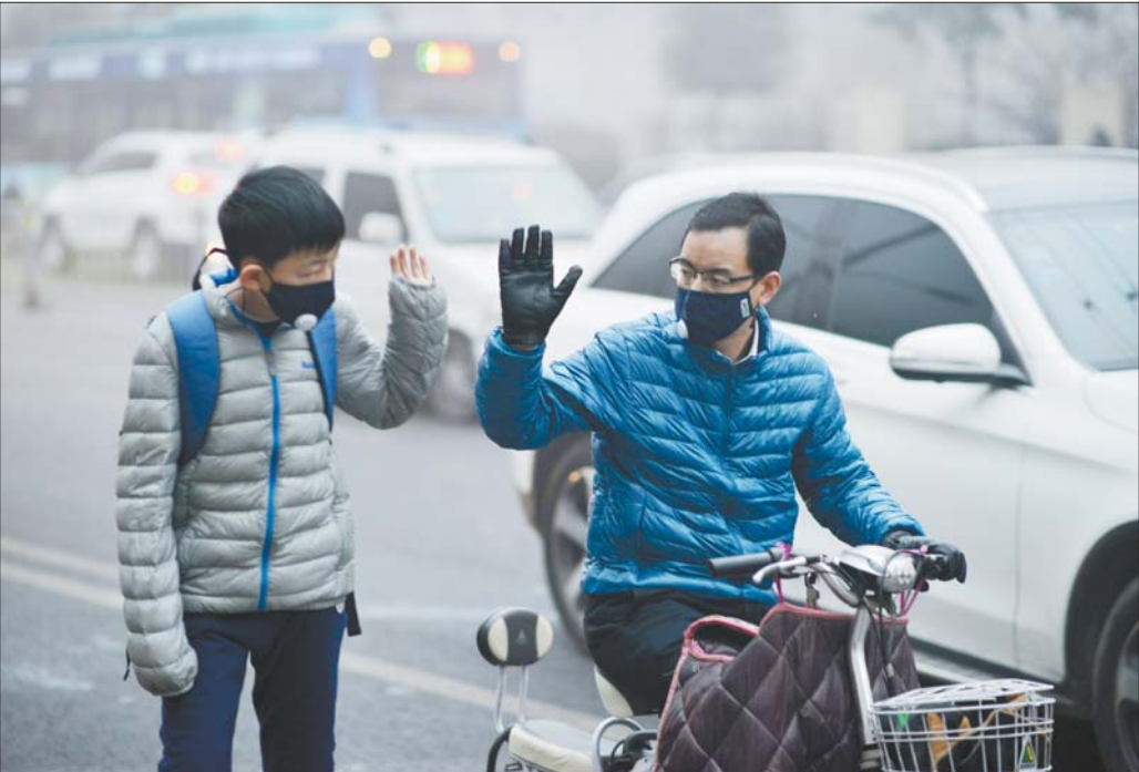
4日深霾笼罩泉城，一对戴着口罩的父子在街头击掌道别。

从新年第一天起，雾霾就开始笼罩省城。对于家长们而言，早就习惯了面对冬天灰蒙蒙的霾中世界，但一想到孩子，很多人想要逃离，只为给孩子一个好的生长环境。 然而更多的，是逃离不了的父母，他们在纠结和迷茫中，努力给孩子使用最好的东西，用自己的力量，尽量削弱雾霾对孩子的影响。