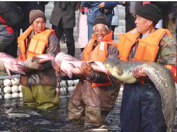
云蒙湖捕鱼文化节上,村民展示捕到的鱼。

有机鱼凭借得天独厚的优质水资源,以其肉质鲜美,肥而不腻,营养丰富等特点,受到广大消费者好评,并畅销北京、天津各大城市。 记者了解到,作为此次捕鱼节的主办方蒙阴县众成渔业养殖专业合作社,已投资三千万元实施生态渔业休闲旅游开发建设项目。该项目包括水上游乐设施、渔村接待中心、渔村民俗博物馆等多个项目,将于2017年陆续开业使用,可带来5000余万元收入,为村民提供百余个就业岗位。此次捕鱼节捕鱼收入将回馈库区群众,对接精准扶贫,达到“以鱼养水”保饮水、“以渔增收”助脱贫的目的,实现生态、经济和社会多重效益。