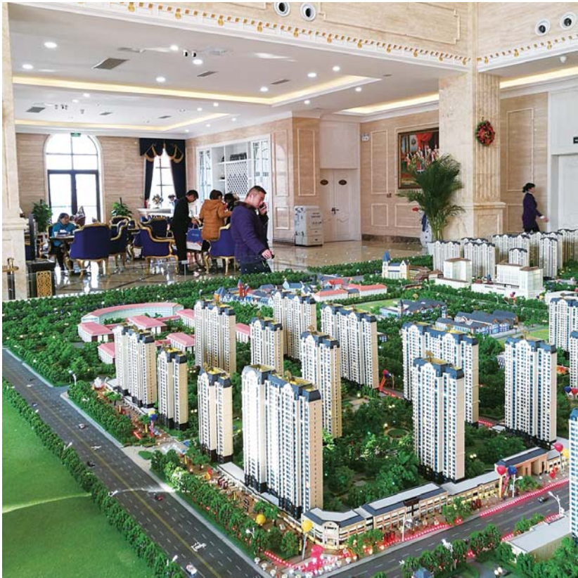
限购之后，售楼处到访量下滑明显。

月，济南市的新房网签量是在逐渐增加的。由于去年12月26日出台了新的政策，预计2017楼市将进入转型期，房产成交量会有所下降，观望态势会进一步加重。”