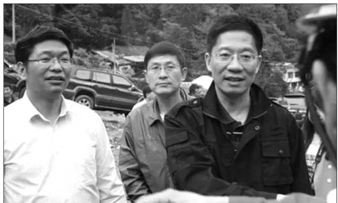
图为钟勉过去外出调研。(资料片)

5日，云南省委原副书记钟勉跨省交流至贵州任职大半个月后，具体职务终于公布。1月5日，钟勉经贵州省人大常委会会议表决被任命为贵州省副省长。由省委副书记转任外省的副省长，这种情况并不多见。