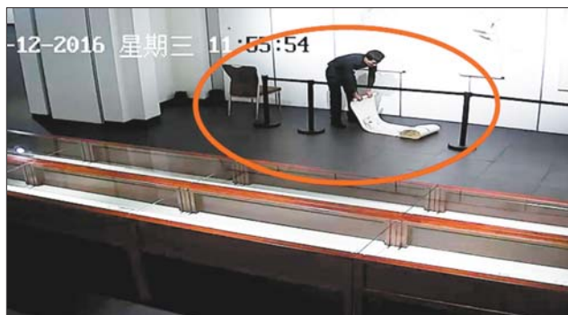
监控拍下的偷画瞬间。