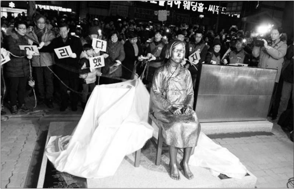
2016年12月31日，“慰安妇”少女铜像在韩国釜山正式揭幕。

目前韩方仅表示遗憾。日本上一次召回驻韩大使还是在2012年8月，时任韩国总统李明博登上日韩争议的独岛(日本