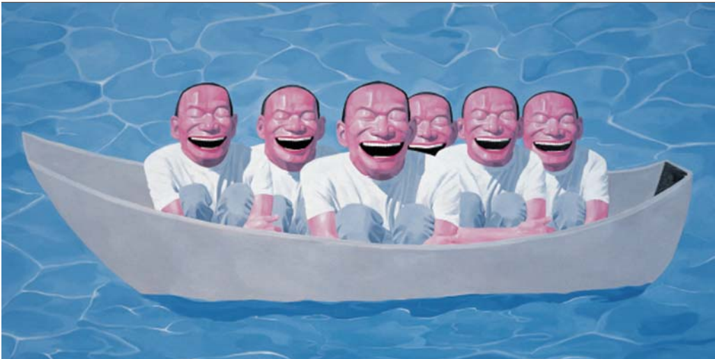
以“闭眼咧嘴笑”的人物形象成名的艺术家岳敏君的作品——一个个都笑得像婴儿，却分明是大人。