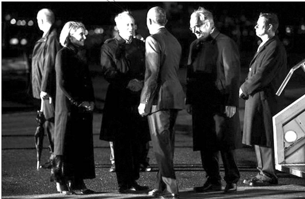
图中和奥巴马(右三)握手者是美国驻德国大使约翰·爱默生,他也是此次被解职的大使之一。