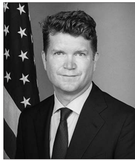
美国驻英国大使马修·巴尔赞此次将离职。