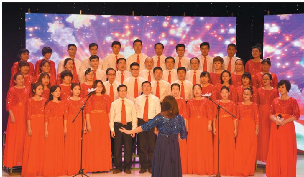
近日, 长清区职业中专举办了一场主题为“激情绘蓝图, 共筑职专梦”的师生联欢会。联欢会节目内容形式多样, 精彩纷呈。联欢会为职专师生搭建了展示舞台, 丰富了他们的课余文化生活。

同时, 本次活动还是一次高颜值的盛会, 为展示当代大学生的青春风采, 主办方将组织长清各高校举办大学生才艺展示活动, 并对评选出的优秀者给予奖励。