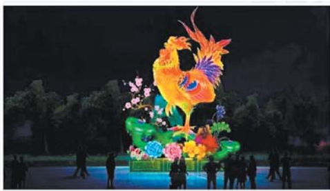
灯会上准备展出的部分花灯。

戏的形式不同, 今年园博园自主办会, 将迎来“天下第一”的自贡花灯。四川自贡被誉为“南国灯城”, 其灯会久负盛名, 有着悠久历史和鲜明特色。作为国家级非物质文化遗产, 自贡花灯以精巧别致的样式、精湛的彩灯工艺、独特的文化品位和魅力, 赢