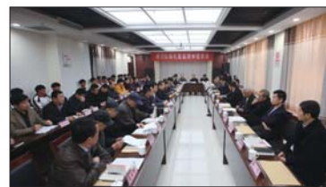
学习弘扬孔繁森精神座谈会

环境孕育希望,理念放飞未来。置身于工匠文化展示区,就会自然而然被伟人的魅力所折服,感受到他们对待科学严谨认真的作风和一丝不苟的态度,从而在精神层面和伟人们进行一次无声的心灵对话,对学生优秀品格的形成起到潜移默化的教育作用。