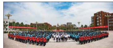
千名师生齐声朗诵《弟子规》