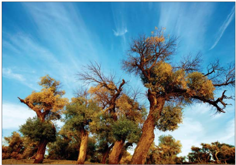
胡杨的形态、神态千变万化