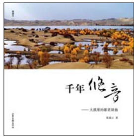
《千年悠音：大漠里的歌者胡杨》张瑞云 著 山东画报出版社

《千年悠音：大漠里的歌者胡杨》是张瑞云先生多年拍摄胡杨的作品结集。在内蒙古和新疆，在不同的地点和时间，作者徜徉在胡杨林里，用文字和镜头记录下胡杨树挺拔的身姿、不屈的生命、多姿的风情。照片记录千年历史，胶片复活不朽生命，全书精选一百余幅摄影佳作，分六个部分展示大漠中的胡杨，辅以精练优美的文字说明，处处可见作者对胡杨的热爱与赞美，本期书坊周刊摘编《千年悠音：大漠里的歌者胡杨》的精美图文，与读者一同分享胡杨独有的魅力。