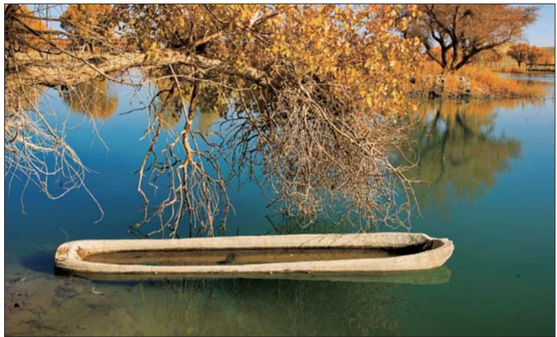
当地人用胡杨制作的独木舟“卡盆船”

独自爬山的时候，看到各种各样的花草树木，时常会想起一句话：一叶一菩提，一花一世界。人愿意思考，探索未知的领域，这是大自然赋予人类的智慧。人类不断发展进步，应该远离愚昧和无知，以科学的宇宙观去观察判断，做出有利于群体发展的行为。我喜欢胡杨，是一种主观情绪。它们的世界怎样，它们的生存如何，只有它们自己知道。我只是在观察之后，觉得胡杨是树中的另类，是树中的活化石。祝愿它们在地球上的荒漠之地，在远离人类的地方，在气候环境日益恶劣的情况下，长期生存下去，遵循着生命的旋律，放声高歌，多彩多姿。