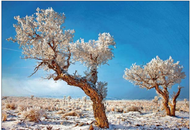
胡杨树像披着洁白的纱在晴空里缓缓起舞