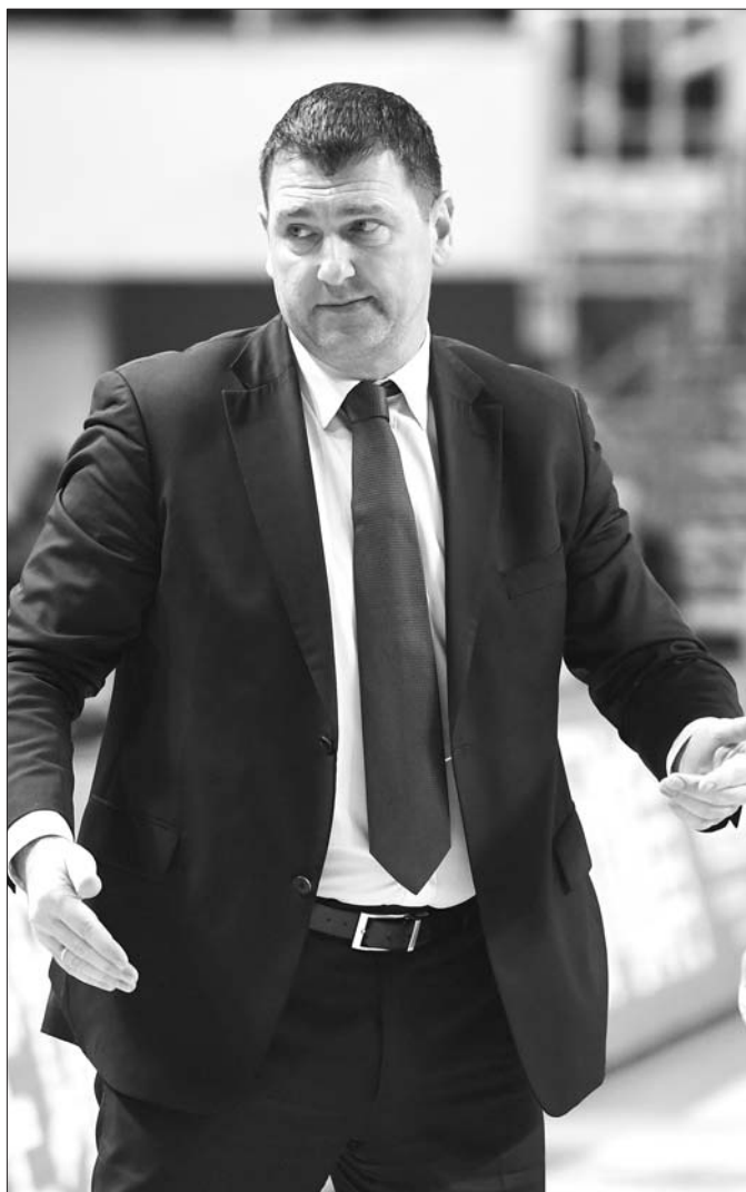
江苏之行山东高速男篮遭遇两连败,回到主场后主帅凯撒压力更大。

江苏队战胜山东之后,凭借两连胜,获胜场次增加到14场,同山东的差距不过两个胜场。养虎为患的后果,是给自己的季后赛名额之争,埋下了一颗“定时炸弹”。