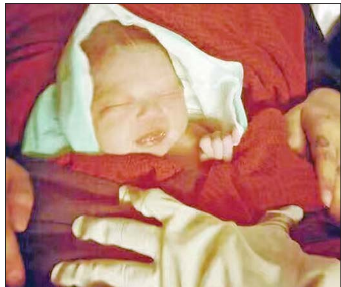
整个航班都在迎接的“小公主”重2.36公斤。