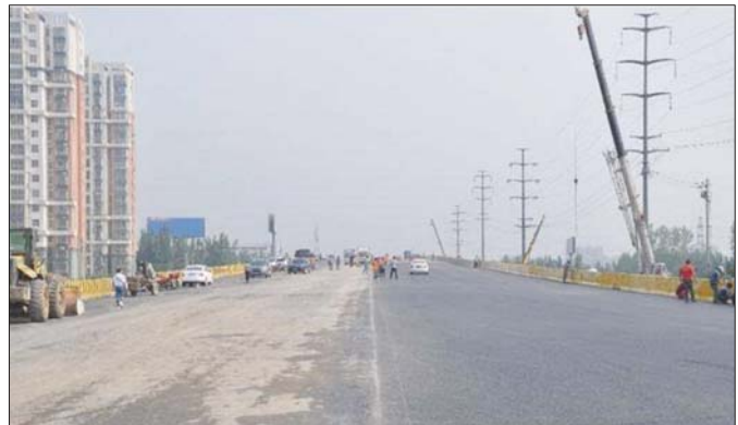
2016年7月,历经八个月施工,柳园路跨济聊高速立交桥通车。加宽改造后的大桥宽了14.25米,进出城区更加方便。(资料片)

建局开展的老旧小区改造工作对全市老旧小区进行了“调查摸底”,确定了改造计划385个,共计45730户。通过印发《聊城市城区老旧小区整治提升改造工作方案》,确定了老旧小区改造的工作原则,明确了详细的工作内容,制定了具体的工作步骤。目前,2015年的8个试点项目已全部开工,2016年的101个项目也已改造完成,惠及居民16278户。通过对老旧小区物业基础设施的整治改造,实现了有物管用房、有公共保洁、有秩序维护等“八有”目标及有清扫保洁、有垃圾清运、有秩序维护等“四有”基本目标。