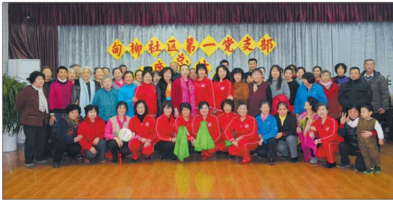
2017年1月5日,旬柳第一社区党员、楼组长、腰鼓队成员、民乐队成员、交通志愿者成员,共60余人召开了“年终总