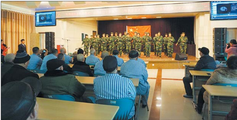
1月11日下午,旬柳新村街道长者日间照料中心嘻秋莎艺术团、旬柳艺术团、柔力球队在旬柳新村第二社区的支持下