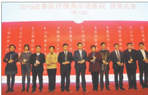
金乡人民医院被授予全国“2016改善医疗服务示范医院”。

自2015年起,国家卫计委在全国医疗卫生系统开展“进一步改善医疗服务行动计划”,通过加强医疗管理,改善服务流程,创新便民就医举措,让人民群众切实感受到医改成效。计划实施以来,金乡县人民医院不断优化再造服务流程,创新诊疗模式,因地制宜,内外结合,以改善医疗服务为抓手,以病人满意放心为目的,探索了一系列便民、惠民医疗新举措,为金乡乃至周边地区的人民群众提供了规范高效的健康服务。