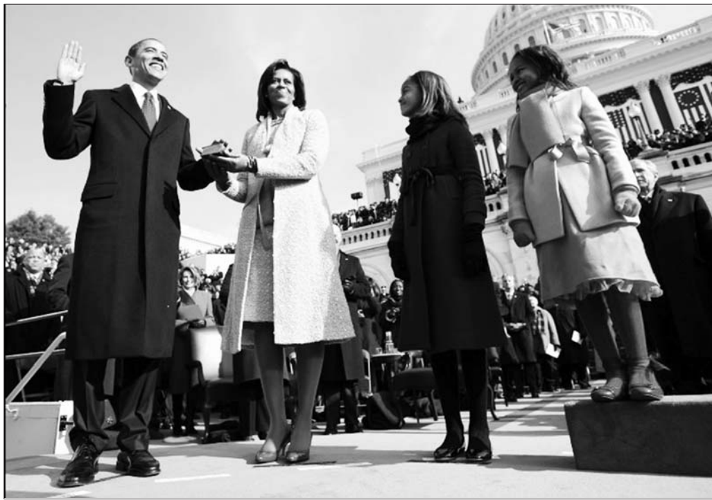
2009年1月20日,奥巴马一家在总统就职典礼上。