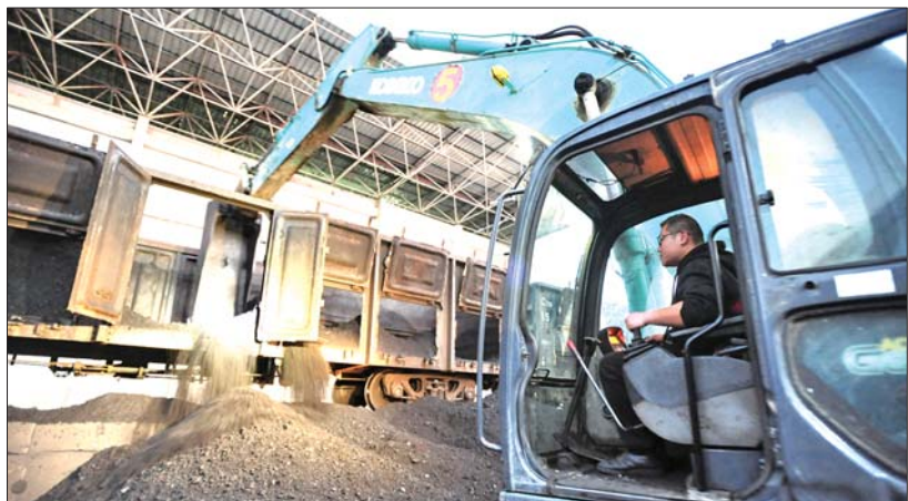
卸煤现在大多是机械化操作,但许多精细活必须人工来收尾。