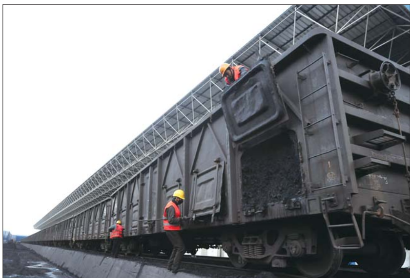
一车煤到场,工人打开车门卸煤。