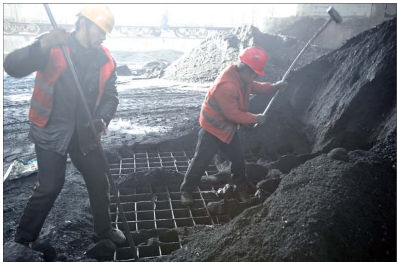
工人们砸烂大块的煤,捅开堵住的漏煤口,以免影响锅炉燃烧。