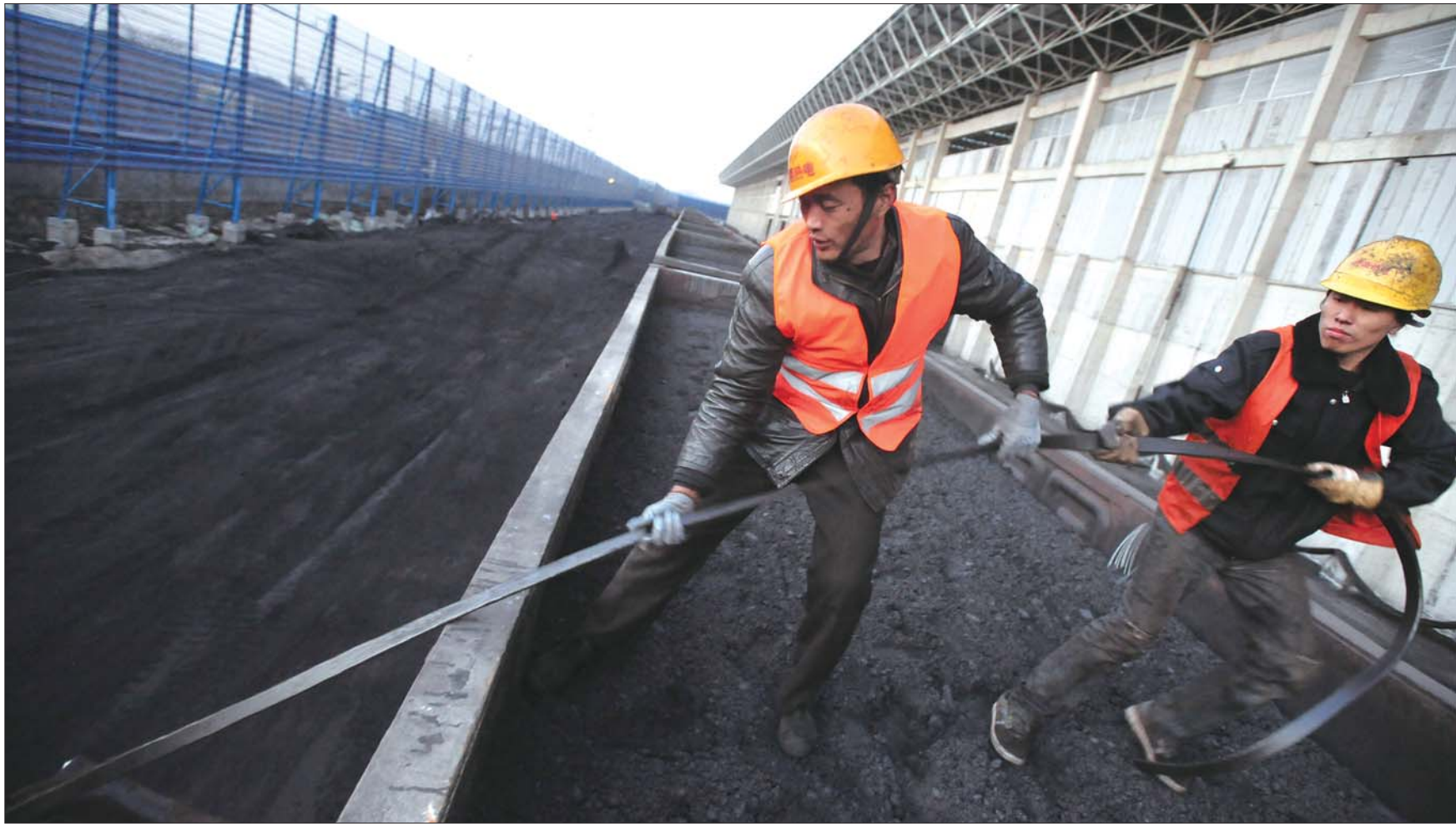
煤车的门非常重,用铁丝封固,要先用大钳子掐断开封,再用大铁锤敲开,然后两个人合力才能拉开。