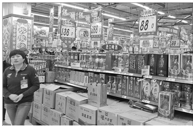
在济南，临近春节，不少中低端白酒都开始打折销售。

不过，朱丹蓬判断，这次的“涨价潮”很难复制2013年的行情。“此前，社会上囤了大批的茅台酒库存，经过3年的消化，市场上的库存早已所剩无几，所以茅台酒才有了提价的信心。茅台酒一向对酒的价格有很强的控制权，近期茅台厂再次召开会议，强调茅台酒不涨价。另外，八项规定仍在影响着整个消费市场，所以短期内价格不会出现暴涨的局面。”朱丹蓬分析说。