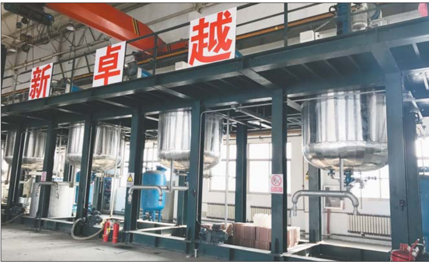
新企业奥卓化学入驻滕州,这是由科技副市长邹美帅促成的。

山东大学教授王禄山如今多了一个外号——“王三挂”。2014年,王禄山成为最早一批被相中的“科技人才服务团”成员。而今年,他从挂职两年的禹城到了济宁高新区,继续担任“科技副职”。他说他更像是“科技红娘”或“科技经纪人”。在他看来,“科技副职”牵线搭桥,畅通了人才通道,实现了派出单位和挂职地的双赢。在拓展定陶区融资渠道的同时,王志飞也开拓了北京银行在定陶区的业务,树立了品牌形象。“第二年,很多周围县市区看到这种模式很好,也纷纷引进金融领域的副职。”一位组织部门相关人士说,组织部门看重的是,通过选拔科技副职的方式,能够为地方真正引进需要的人才。现在,很多县市区一把手主动报送需求,一些组织部门为此亲自到单位“求贤”。一位组织部门相关人士说,有时甚至要去好几趟,花了一个多月才“求”来了人才。第二批科技副职中,有27人是因为前一年工作成绩突出、得到挂职地高度认可后,继续第二期挂职。“‘科技副职’拓宽了引进人才的渠道。”