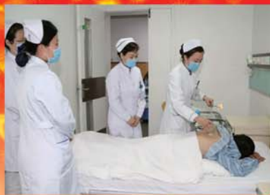
开展中医护理适宜技术