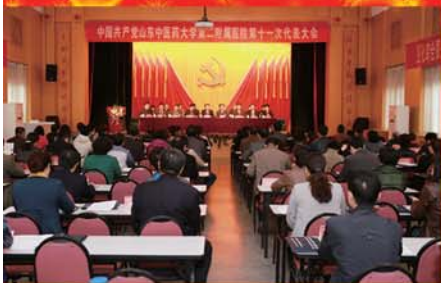
医院第十一次党代会胜利召开