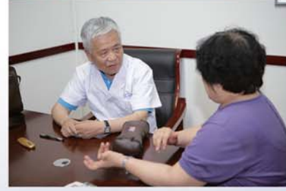
全省首家国家级名老中医传承工作室落户医院社区,国家名老中医刘持年教授正在为患者诊疗