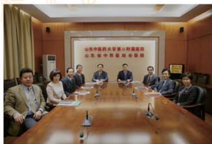
医院领导班子合影

医院始终坚持“中西医结合,特色发展”的办院方向,充分发挥中西医结合特色优势,以提高临床疗效为重点,不断提升中西医结合服务能力,形成了“院有专科、科有专病,人有专长、病有专药”的专业发展格局,确立了医院的特色品牌和服务优势,争取早日实现山东省人民政府提出的“扩大省中西医结合医院规模,强化综合服务能力和中医特色建设,建成全国一流的中西医结合医院”的目标。