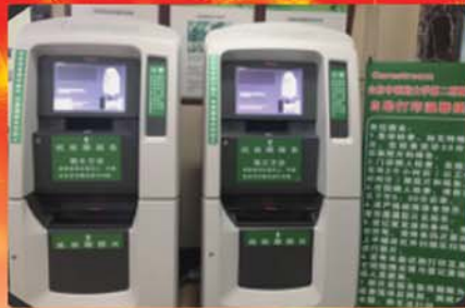
放射科启用自助胶片打印系统