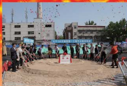
2016年4月25日山东中医药大学第二附属医院 举行新综合病房大楼奠基仪式