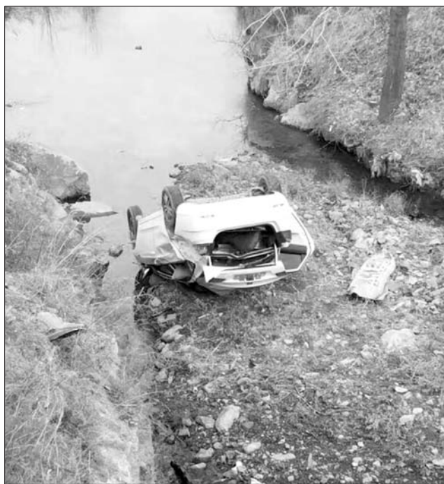
莒南一名司机酒后驾车坠入桥下。

其中,临沂查处酒后驾驶317起;淄博共现场查处各类交通违法行为2843起,其中酒驾27起,违法载人5起,涉牌涉证36起;潍坊共查获酒后驾驶56起;青岛市黄岛共查处酒司机17名,其中1人因醉酒驾车涉嫌危险驾驶罪被刑事拘留;2月3日,聊城共有49人因酒后驾驶机动车被查。