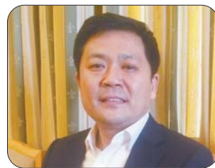
省人大代表、夏津县委书记才玉璞:

村民全部住进崭新的“别墅”,其实没有什么秘诀,党支部在村里成立了合作社,通过土地流转和大棚种植,让全村1600亩土地实现了100%流转,而流转的土地则100%种上了大棚。