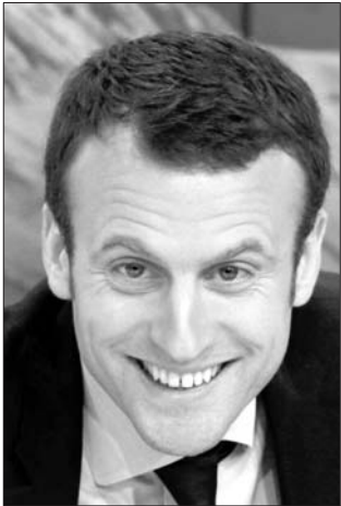
埃马纽埃尔·马克龙