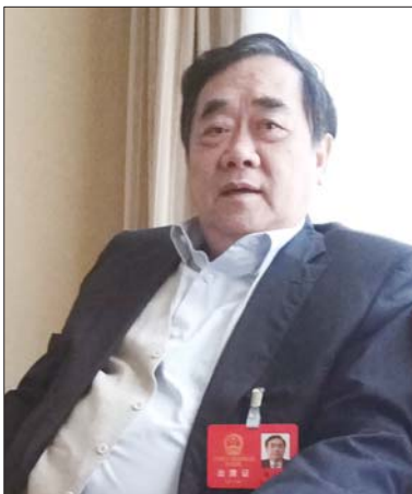
省人大代表、圣泉集团董事长唐一林