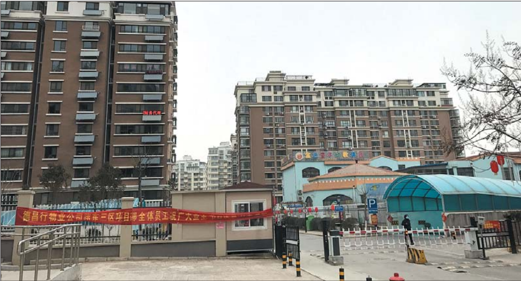
伟东新都三区。

开发商没钱出资。”李先生称,2016年年中,开发商——济南伟东置业有限公司相关负责人曾承诺,在2016年年底动工改造小区电网,2017年10月解决此事。“已经过去1个月了,一直没见到施工动静”。