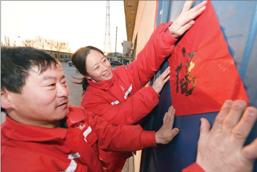
注采站员工贴春联。