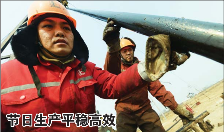
节日期间生产平稳高效

正月初四,胜利油田河口采油厂30多个作业队就陆续在百里油区打响新春夺油上产序幕,为采油厂圆满完成年度生产经营任务奠定坚实基础。据统计,节日期间,该厂组织油井热洗25井次、替放套137井次,增油119吨,单井拉油343车3739吨,累计注汽18041吨,日均开井数2059口,实现节日生产平稳高效运行。