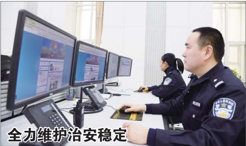
全力维护治安稳定

春节期间,滨海各级公安机关严密巡逻防控等各项工作,有效维护了辖区社会政治稳定和治安大局平稳。据统计,节日期间,滨海各级公安机关共接警164起,同比去年同期减少16%;部署社会面巡控力量2400余人次,同比增加10%;部署社区巡控力量1000余人次,同比增加20%;检查重点消防单位、部位265个,发现整改隐患42处,治安清查重点部位、场所295余处。